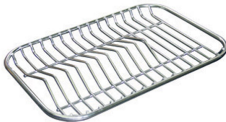
Tellerständer aus Edelstahl 8100 280