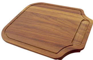
Schneidebrett aus Iroko-Holz 8655 000